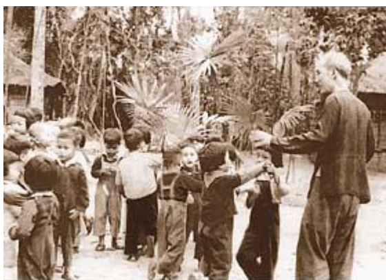
Bác Hồ với thiếu nhi năm 1950.

Báo Sự Thật, số 134 ra ngày 1-6-1950, đăng bức thư gửi thiếu nhi toàn quốc nhân ngày 1-6. Trong thư Bác viết: "Các cháu yêu quý! Ngày 1-6 là ngày của các cháu bé khắp cả các nước trên thế giới. Đáng lẽ tất cả các cháu đều được no ấm, được vui chơi, được học hành như trẻ con ở Liên Xô. Song ở các nước tư bản, cha mẹ là người lao động bị bóc lột, thì trẻ con cũng bị bóc lột, phải chịu cực khổ. Ví dụ: Mỹ là một nước nhiều tiền bạc nhất, có những nhà đại phú, ngòi mát ăn bát vàng. Nhưng con nhà lao động thì lên 5, lên 6 tuổi đã phải đi làm thuê, làm mướn. Ở nước Việt Nam ta thì, vì giặc Pháp gây ra chiến tranh, chúng nó đốt nhà, giết người, cướp của. Vì vậy, người lớn phải kháng chiến, trẻ con cũng phải kháng chiến". Chúng ta cảm động trước tình cảm, lời hứa và trách nhiệm của Người dành cho thiếu nhi: "Bác thương các cháu lắm. Bác hứa với các cháu rằng: đến ngày đánh đuổi hết giặc Pháp, kháng chiến thành công, thì Bác cùng Chính phủ và các đoàn thể cùng cố gắng làm cho các cháu cùng được no ấm, đều được vui chơi, đều được học hành, đều được sung sướng...".