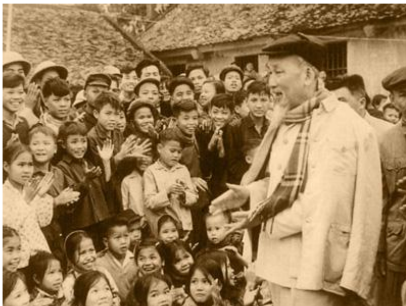
Bác Hồ với các cháu thiếu nhi năm 1967.

Năm 1955, nhân Ngày 1-6, Bác có thư gửi cho các cháu và cán bộ các trường miền Nam, Bác nêu: Bác muốn đi thăm các cháu, nhưng vì bận quá mà chưa đi được. Lần này, Bác khuyên các cháu: "Trước hết, các cháu phải thương yêu giúp đỡ nhau, phải đoàn kết chặt chẽ. Đoàn kết giữa các cháu lớn và các cháu bé... giữa các cháu vùng này với các cháu vùng khác... giữa các cháu và các cô, các chú cán bộ". Bác nhắc các cháu thiếu nhi các trường miền Nam phải "yêu lao động, giữ kỷ luật. Chớ tự do phóng túng, phải tự lực cánh sinh... Các cháu nên thi đua, thi đua học tập, thi đua trong mọi việc...". Bác căn dặn các cô, các chú cán bộ "phải thương yêu các cháu như con em ruột thịt của mình" để chăm nom, bồi dưỡng các cháu - những người chủ tương lai của nước nhà".